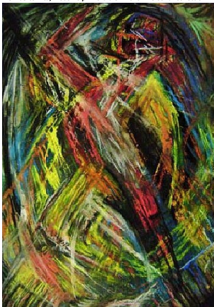
Umberto Vita, Eratismo primordiale – 2010 – Personal Collection